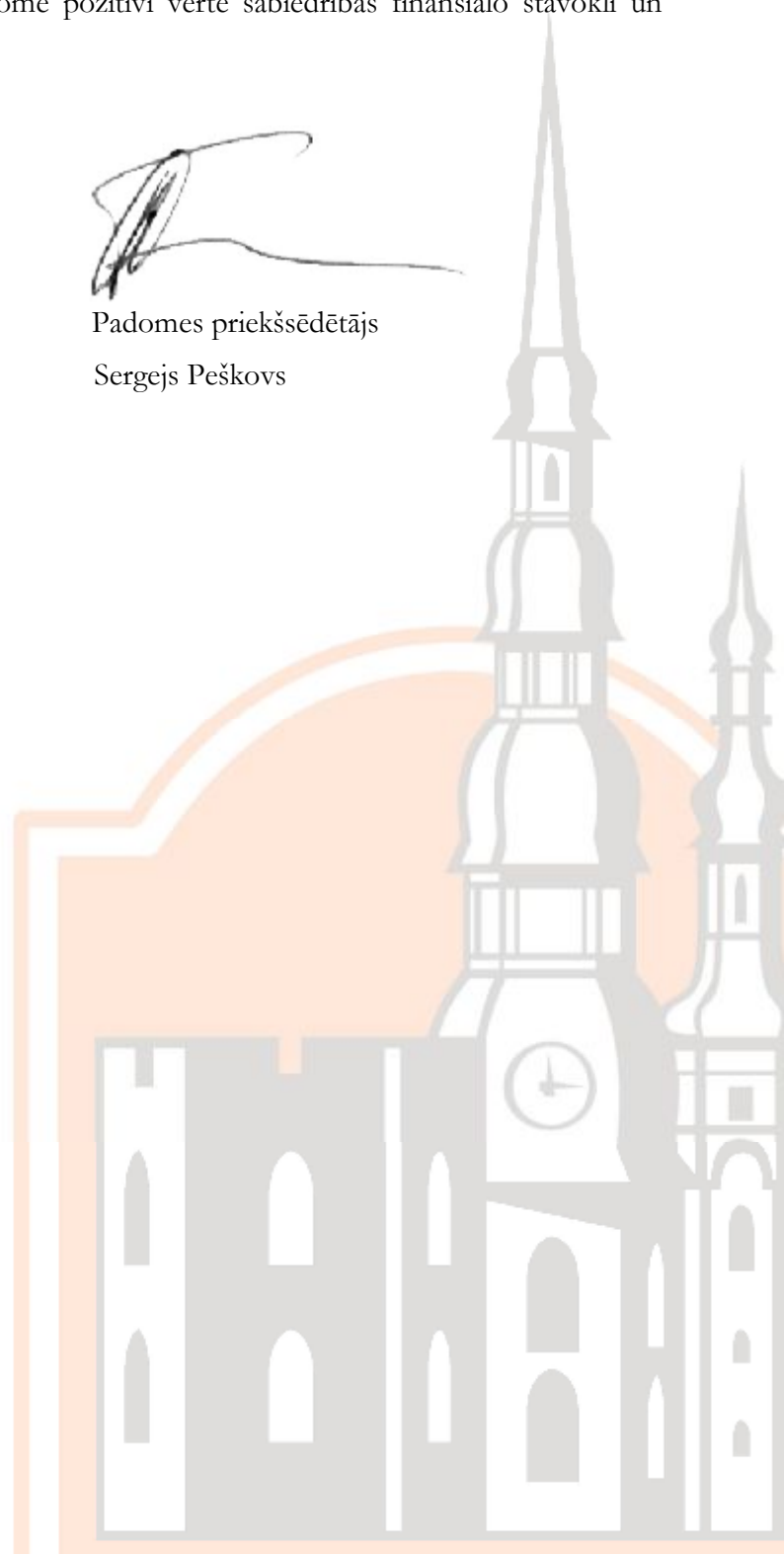
Padomes priekšsēdētājs Sergejs Peškova